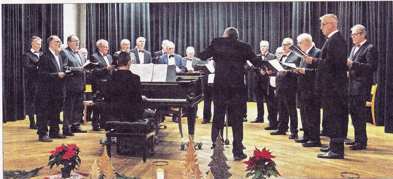
Der Männergesangverein Eintracht Kollnau begeisterte das Publikum.